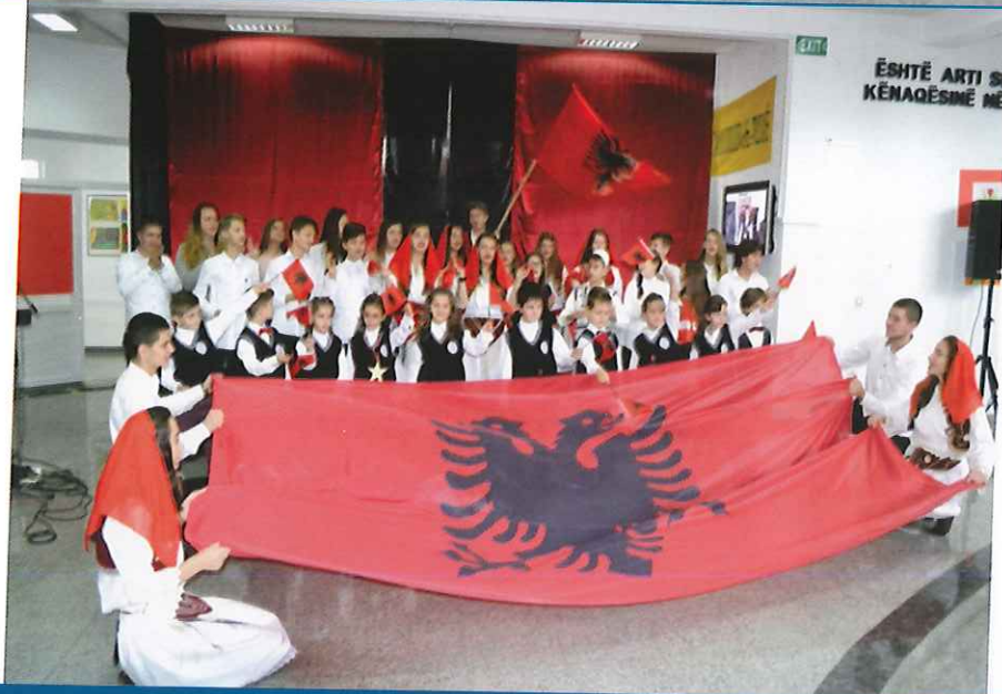
...Festuem Ditën e Flamurit Kombëtar!