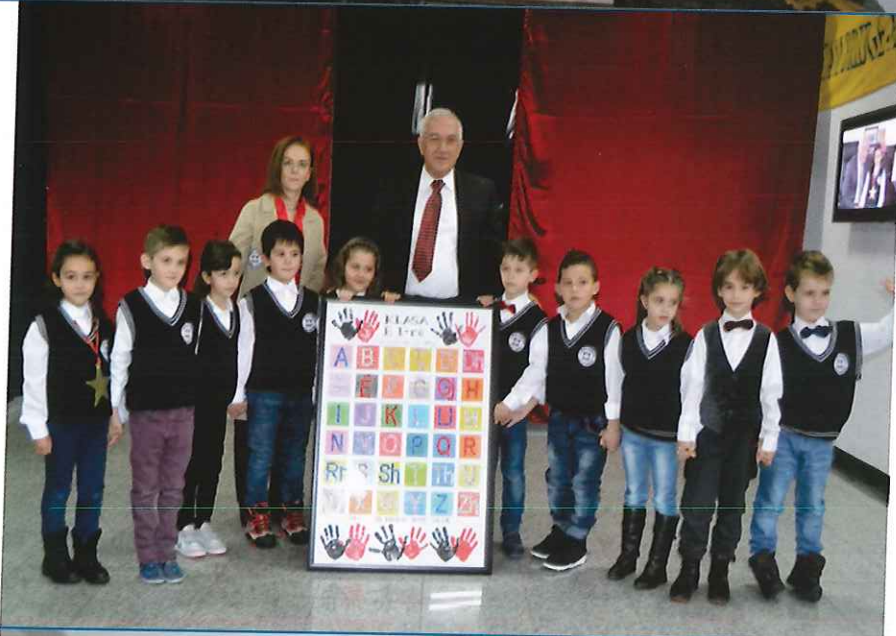
...dhurata jonë e parë për Drejtorin e Shkollës...