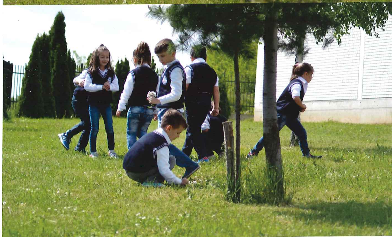
Mirëupafshim në Festën e Abetarës Me 28 maj 2016